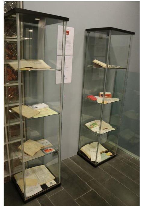
Skáparnir eru á stigapallinum fyrir framan Héraðsskjalasafnið.

Á skjaladaginn 9. nóvember lagði safnið til efni á sameiginlegan vef opinberra skjalasafna. Yfirskrift dagsins var Geymt en ekki gleymt og má til sanns vegar færa að ýmislegt gott er geymt á skjalasöfnum sem þó er ekki gleymt og full ástæða til að draga fram í dagsljósið. Í október og nóvember voru skipulagsmál á Oddeyrartanga mikið rædd í samfélaginu og því voru greinar safnsins á skjaladagsvefnum tengdar mannlífi og sorphaugum á Oddeyrartanganum og sambýli íbúa á Oddeyrinni við Glerá.