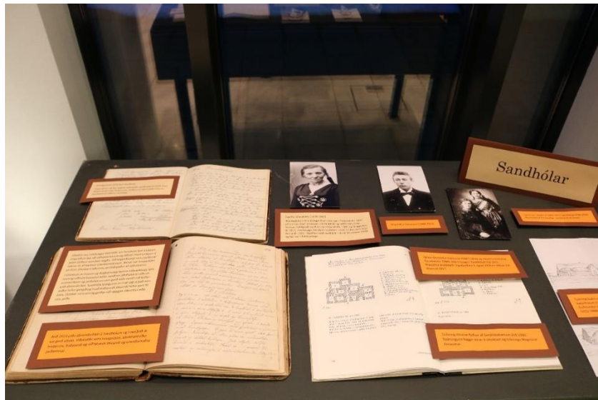
Frá sýningunni „Hús og heimili“

Safnið tók þátt í Norræna skjaladeginum 11. nóvember 2017 með tvennum hætti. Annars vegar með því að senda inn efni á vefinn skjaladagur.is og hins vegar var sett upp sýningin Hús og heimili í anddyri safnsins. Sýningarefnið var í takt við yfirskriftina en sýndar voru fjölbreyttar heimildir sem notast má við þegar saga húsa er könnuð. Sem dæmi voru sýnd skjöl og myndir sem varða húsin og heimilin Lundargötu 10, Sandhóla í Eyjafjarðarsveit, Sigurhæðir á Akureyri og Steinsstaði í Öxnadal. Sýningin stóð út nóvember.