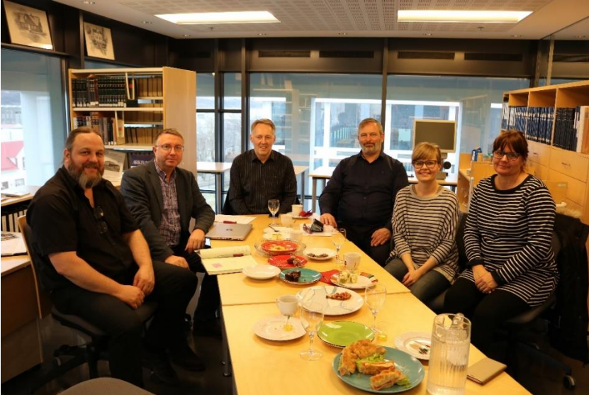
Akureyrarbær rekur safnið og stjórn Akureyrarstofu fer með málefni þess. Í apríl hélt stjórn Akureyrarstofu fund sinn á safninu.

Starfssvæði Héraðsskjalasafnsins á Akureyri nær yfir fimm sveitarfélög við Eyjafjörð, frá Hörgársveit vestan fjarðar til og með Grýtubakkahreppi austan Eyjafjarðar. Sveitarfélögin eru Akureyri ásamt Grímsey og Hrísey, Eyjafjarðarsveit, Grýtubakkahreppur, Hörgársveit og Svalbarðsstrandarhreppur. Íbúar á svæðinu voru 21.236 þann 1. desember 2017.