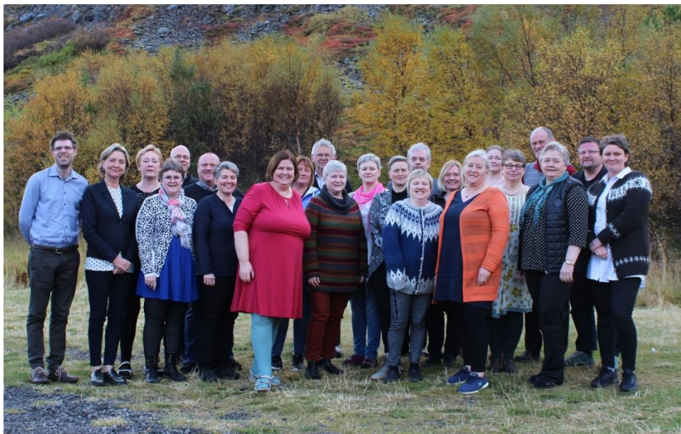
Þátttakendur á ráðstefnu skjalavarða að Laugum í Sælingsdal.

Skjalaverðir tóku þátt í árlegri ráðstefnu og fræðslufundi Félags íslenskra héraðsskjalavarða í september sem að þessu sinni var haldin að Laugum í Sælingsdal í umsjá Héraðsskjalasafns Dalasýslu. Þar var fjallað m.a. um ljósmyndun og miðlun skjala á vef, vefkerfi og skjalaskráningarkerfi, neyðaráætlanir, rafræna langtíma-varðveislu, persónuvernd og upplýsingarétt, starfsmat sveitarfélaga, Facebook sem miðlunartæki, samstarf við skóla og fleira.